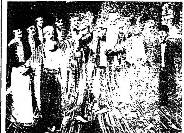
لوحة تمثل رؤساء الاسر بوزراء ونصاري في دير القصر يقسمون في خلة البروز في ٢٧ ايار ١٨٤٠ بان يجربوا ابراهيم بلشا حتى اخراجه من لبنان ( بريشة اسمعيل بنو )

التاريخ نور يعكس اشعة على الماضي والحاضر والمستقبل، وينير سبل الشعوب في مسيرتها، والسريع على هديه، وإذا أهل قلة الشعوب، ونواياها، وضاعتها، وهياكلها والمسؤولون فيها فراءة تواريخ بلادهم، والتامل في محتوياتها، وقوموا في الخطر الكبير، واصلوا طرق الحياة، وساروا في الزوال، وهذا قول بعض المؤرخين، والمفكرين، والسياسيين في اهمية التاريخ..